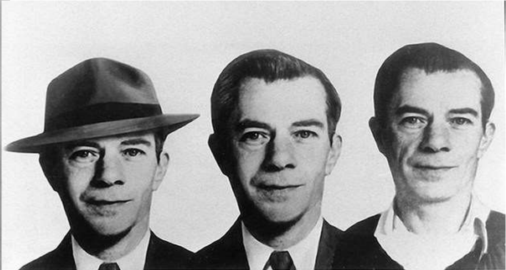
WILLIAM FRANCIS SUTTON,